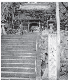
八十八番札所大窪寺