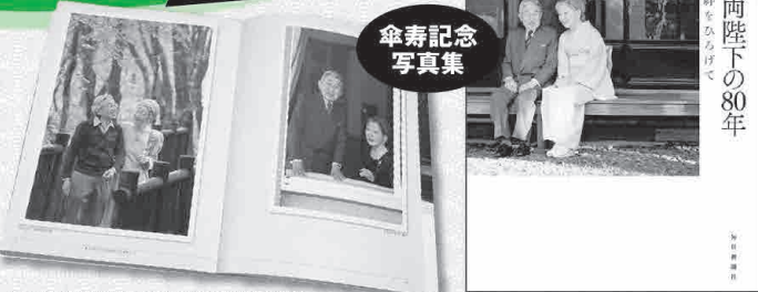
皇室記者も初めてみるお品、初めて知るエピソードが満載。宮内庁侍従職監修による永久保存版！